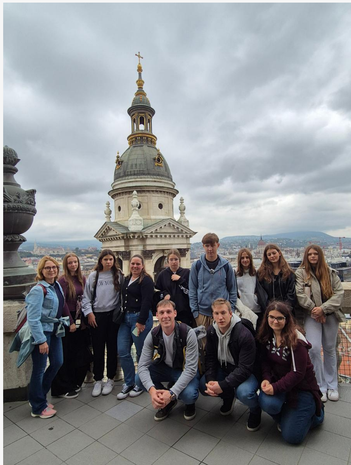
Mobilnost - Budimpešta