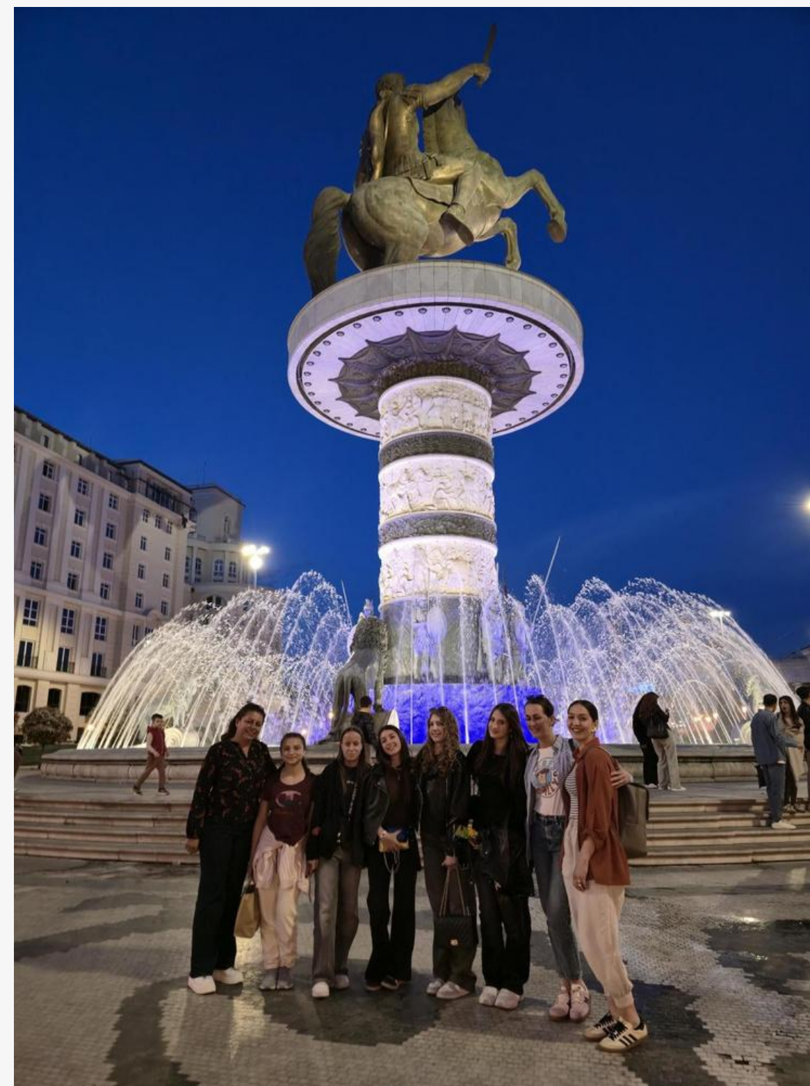
Mobilnost - Skoplje